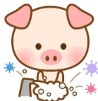
手洗い・うがいをする (左上から手洗いの順番)